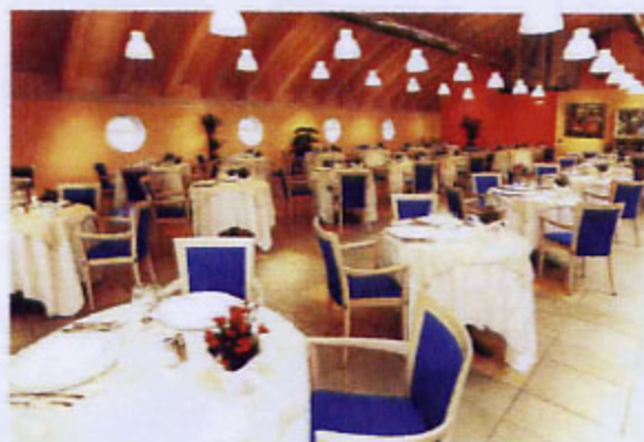
Sopra: uno sguardo sul cortile interno di Farm dimora di lusso a Mazzarino (Caltanissetta); è una delle proposte di Sicilydeluxe. A sinistra: la sala da pranzo del nuovo albergo Caesius Thermae a Bardolino (Verona), sulle rive del lago di Garda.